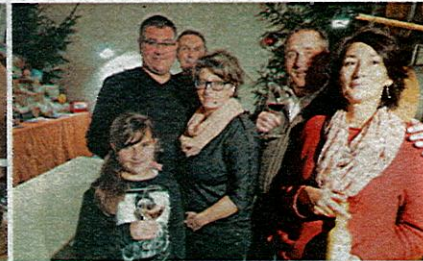
Im Weinkeller vor den Angeboten der Gastaussteller.